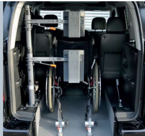
Das Fahrzeug kann mit der Kopf- und Rückenstütze FUTURESAFE ausgestattet werden.