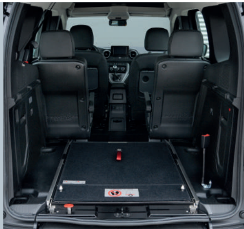
Die eingeklappte EASYFLEX Rampe ermöglicht die volle Nutzung des Kofferraums.