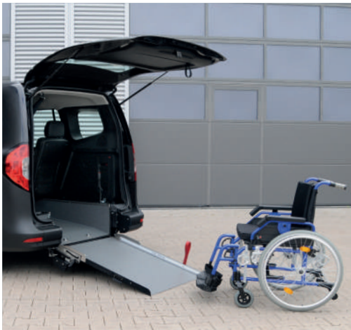
Bei ausgeklappter Rampe lässt sich das Fahrzeug bequem mit dem Rollstuhl befahren.