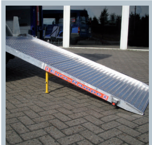
La rampe avec support augmente la capacité de charge du véhicule de 200 kg