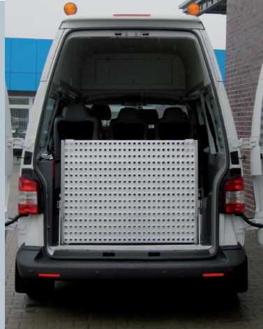
Fahrzeug mit eingeklappter Rampe. Durchsicht nach hinten bleibt erhalten.