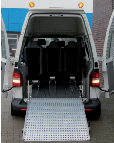
Abgesenktes Fahrzeug zur Aufnahme der Fahrgäste bereit.