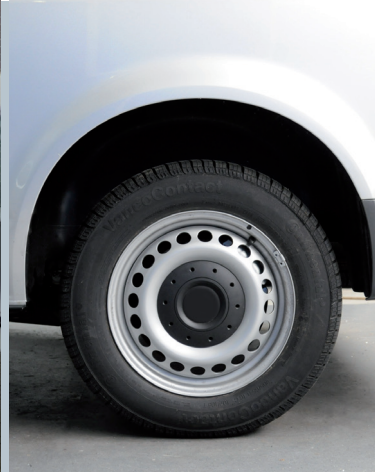
Abfahrereites Fahrzeug (normale Höhe)