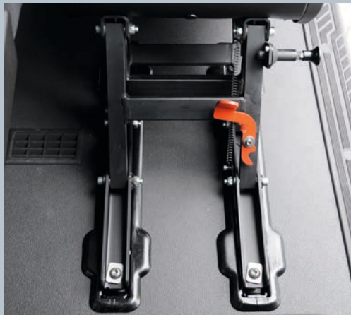
Fußpedal zur einfachen Entriegelung aus der 3. Sitzreihe