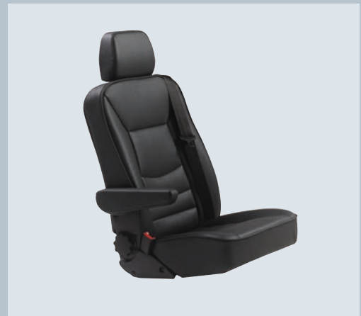
Optionaler XL Komfortsitz