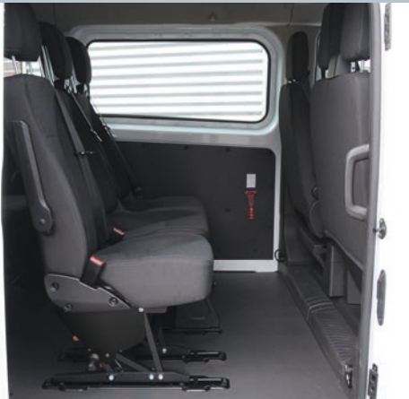
Klappsitz Standard in Fahrposition