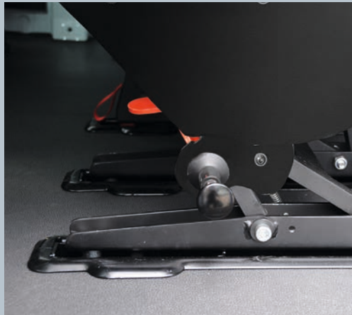
Sitzfuß mit Entriegelungsknopf und Fußpedal für eine einfache Bedienung