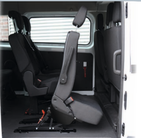
Klappsitz Standard in gekippter Position