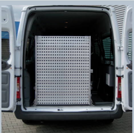
Eingeklappte Eurorampe in Ruhestellung im Fahrzeugheck.