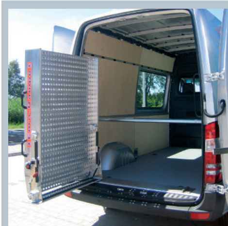
Fahrzeug mit schwenkbarer Eurorampe.